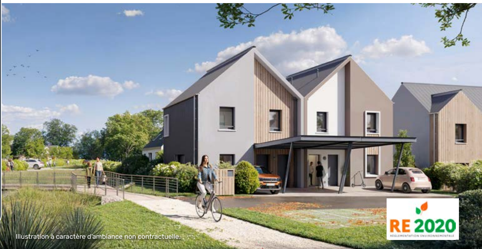
Illustration à caractère d'ambiance non contractuelle.