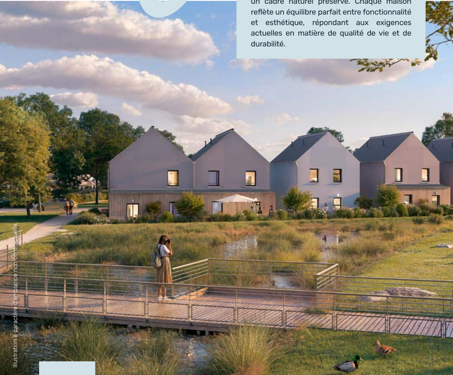
Illustration à caractère d'ambiance non contractuelle.

Situé au cœur du quartier des Coteaux de la Viennois, le programme Villas Viennois, propose 17 maisons T4 et T5 conçues pour allier modernité, bien-être et respect de l'environnement. Adaptées aux besoins des familles, ces habitations se distinguent grâce à leur architecture contemporaine aux formes variées et leur intégration harmonieuse dans un cadre naturel préservé. Chaque maison reflète un équilibre parfait entre fonctionnalité et esthétique, répondant aux exigences actuelles en matière de qualité de vie et de durabilité.